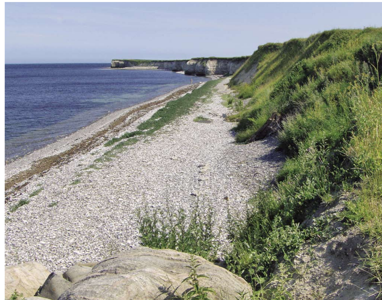
Denne pjece er udarbejdet af Danmarks Naturfredningsforening, Norddjurs afdeling.

Danmarks Naturfredningsforening vil gerne i samarbejde med Norddjurs Kommune undersøge mulighederne for at få vand i dele af Kolind-sund eller måske på langt sigt: Vand i hele Kolindsund.